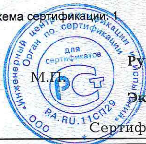
Схема сертификации: 1